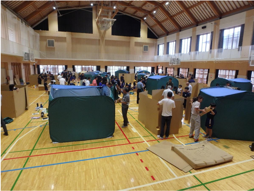
避難所設置訓練でテントや仕切りなどの組み立ての様子