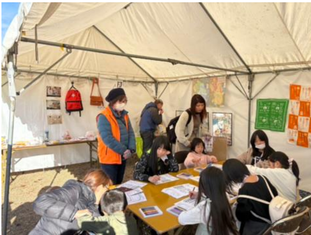
防災ぬりえを行う参加者