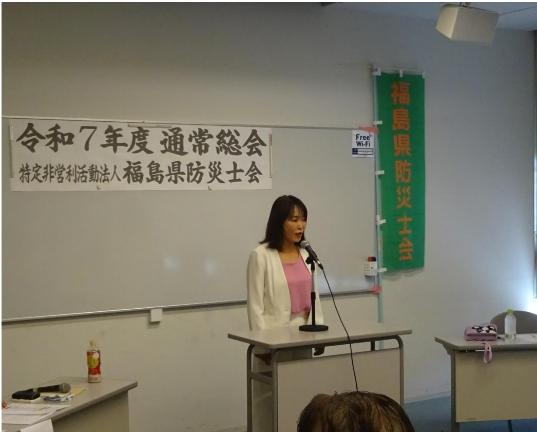
来賓挨拶をする森まさこ参議院議員