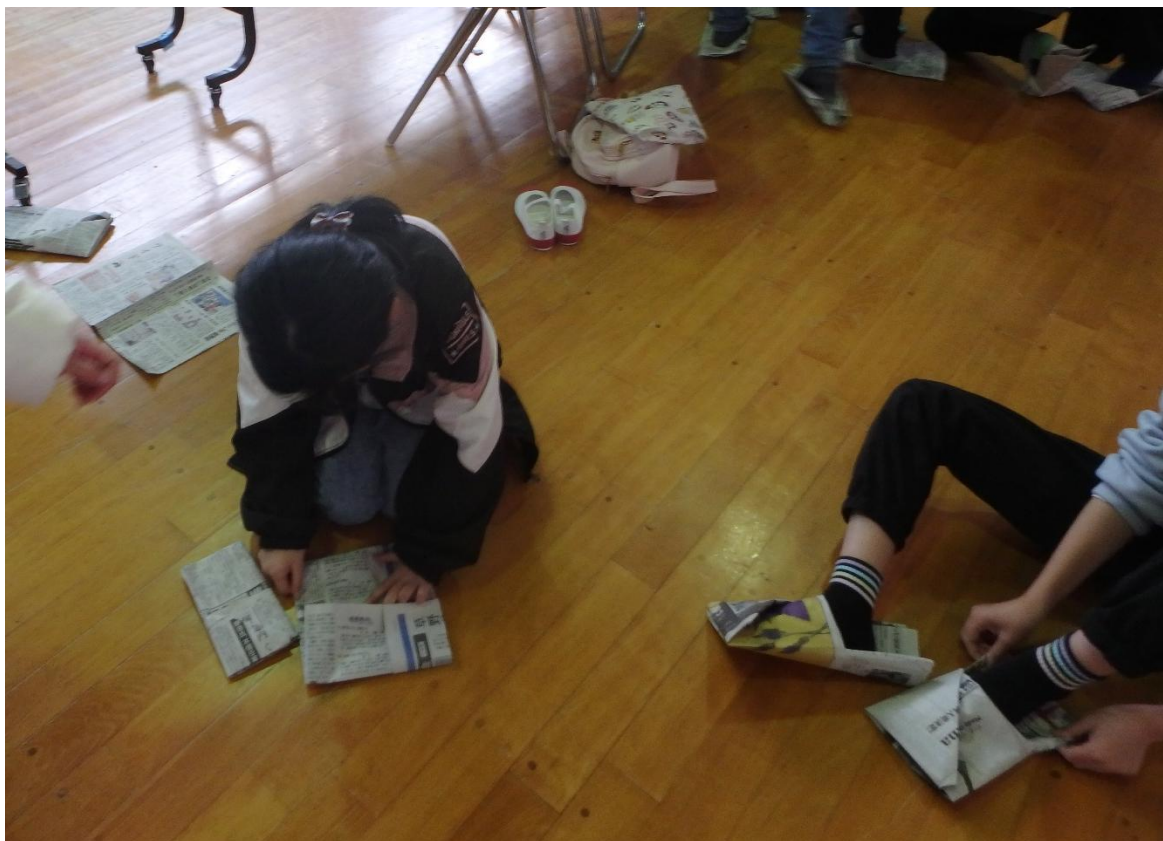
新聞紙スリッパの出来栄を確認する参加者