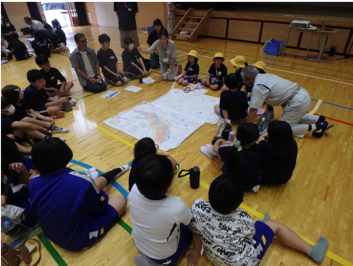
ハザードマップを囲む小学生たち