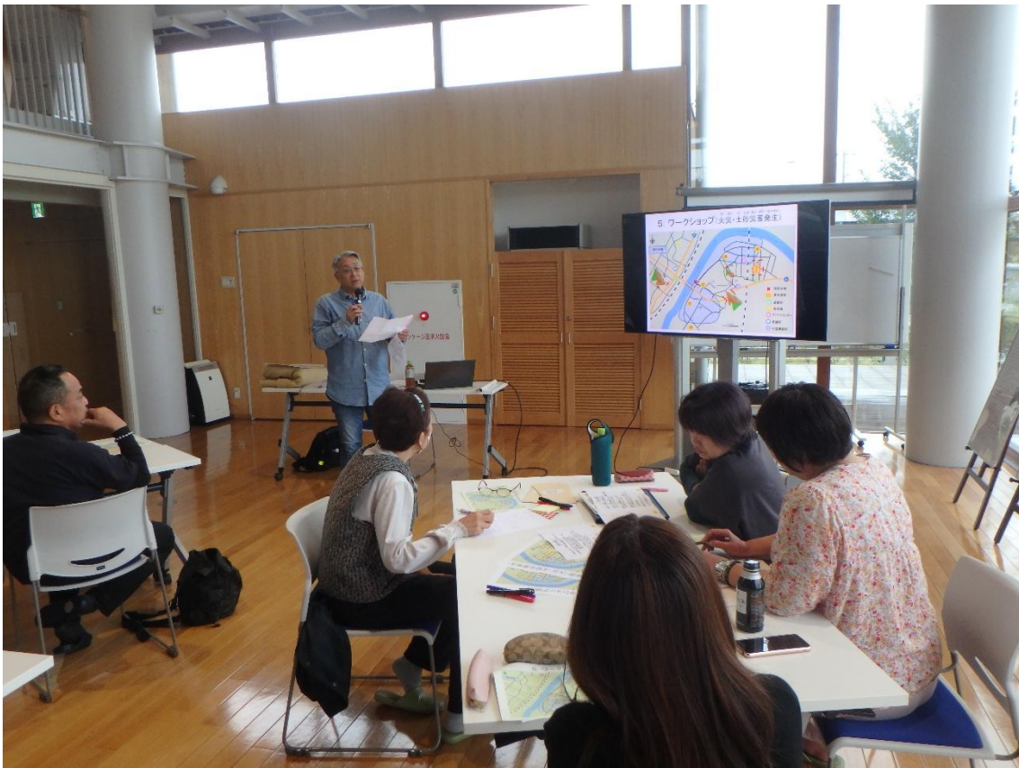
災害図上演習まとめと発表（発表する参加者）の様子