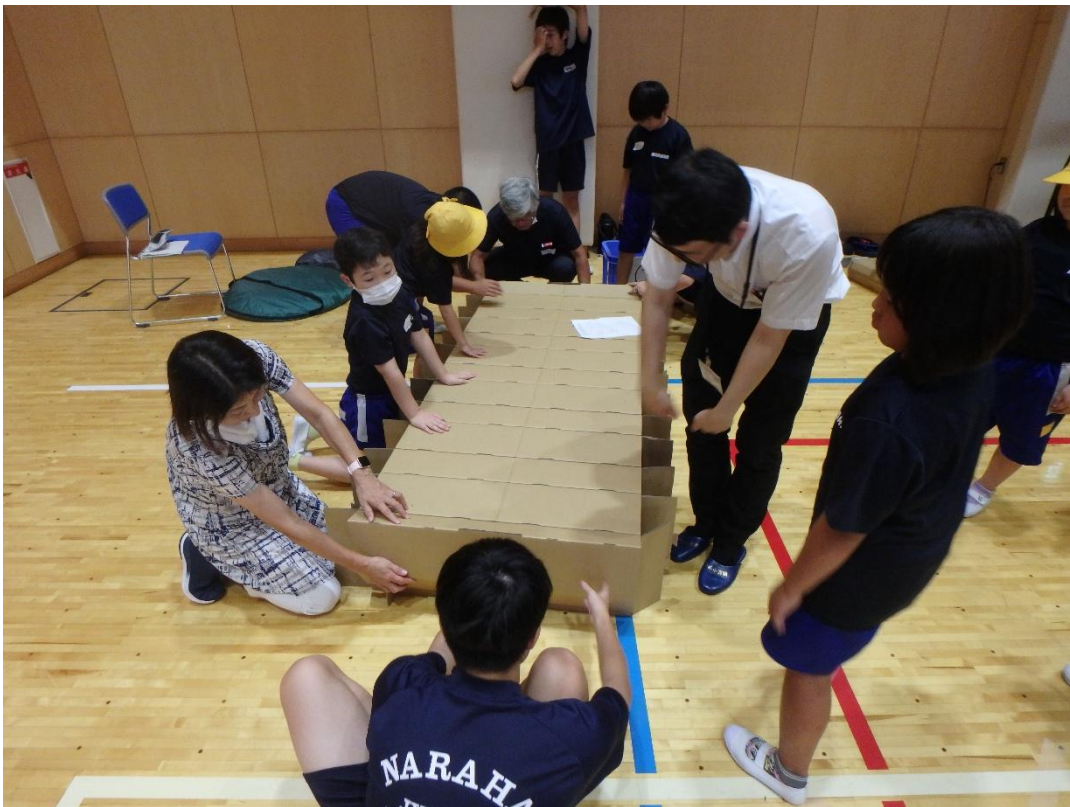
段ボールベットを作りの様子